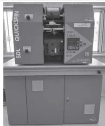
شکل ۱- نمایی از دستگاه ریسندگی چرخانه‌ای مورد استفاده.